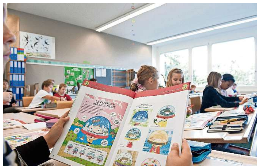
An Schülern laborieren. Wenn Kinder Französisch-Ziele erreichen, liegt es nicht an Mille feuilles, sondern an guten Lehrern, die Defizite ausgleichen.